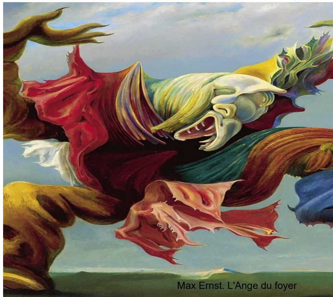
Max Ernst. L'Ange du foyer